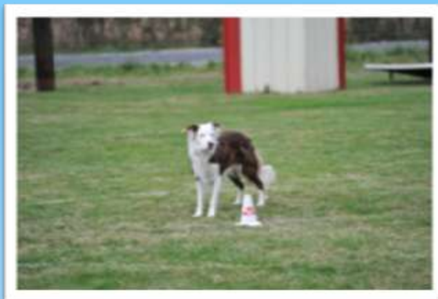
Ulrika Brive 2010

Le conducteur et son chien en position de base à 10m du cône envoie son chien au cône. Le bloque en position debout, l'envoie ensuite au carré, le bloque en position couchée après une marche dirigée par le commissaire de terrain rappelle son chien au pied.