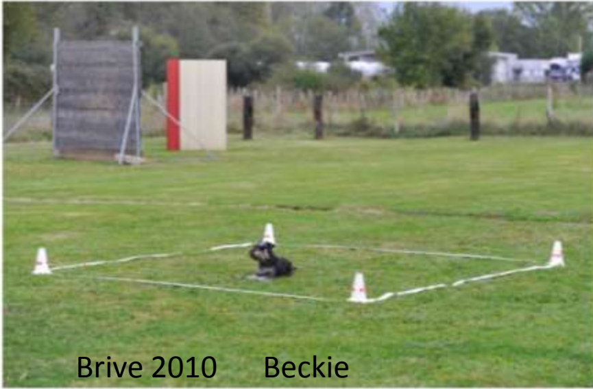
Brive 2010 Beckie