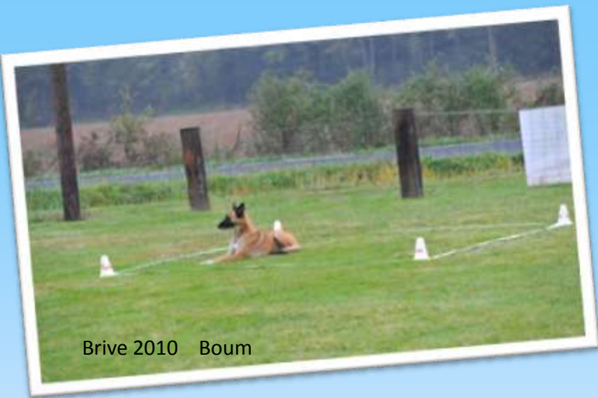
Brive 2010 Boum

Il y a plusieurs façons d'aborder l'exercice, on peut le concevoir comme un « en avant ». Ou, on peut essayer de faire comprendre au chien que cet espace à l'intérieur de ces 4 plots est un carré.