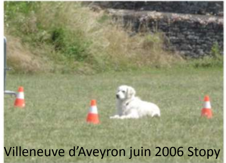
Villeneuve d'Aveyron juin 2006 Stopy