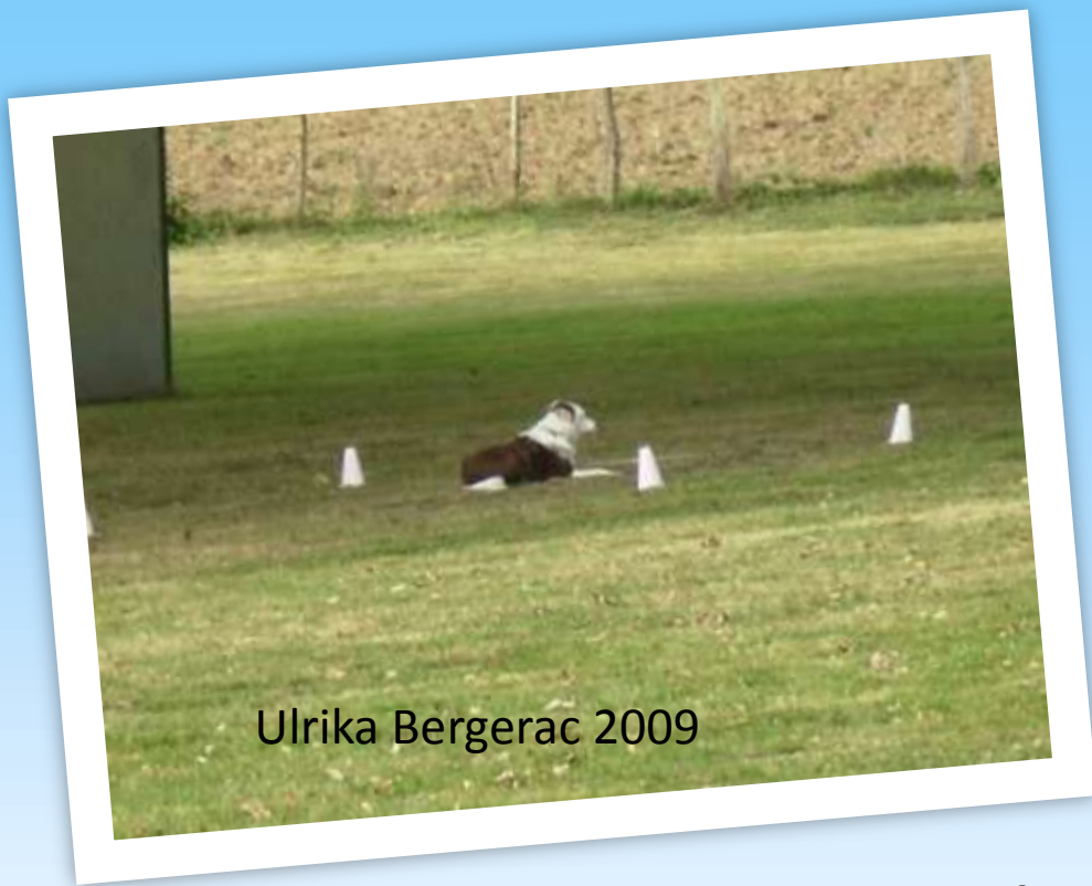
Ulrika Bergerac 2009