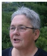
Vice présidente Monitrice